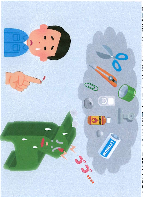
①金属類（アルミ、鉄等）やピン、缶は入れずにご提供ください

JRCC委員会では、空きかん、ベルマーク他に、ペットボトルキャップの回収を始めました。空きかん、ベルマークと一緒にご家庭にあるペットボトルキャップを持ってきていただくけると助かります。回収したペットボトルキャップは、リサイクルの原料に生まれ変わります。みなさんのご理解、ご協力をよろしくお願いいたします。 ※ペットボトルキャップ回収の注意事項は、下の図を参考にしてください。