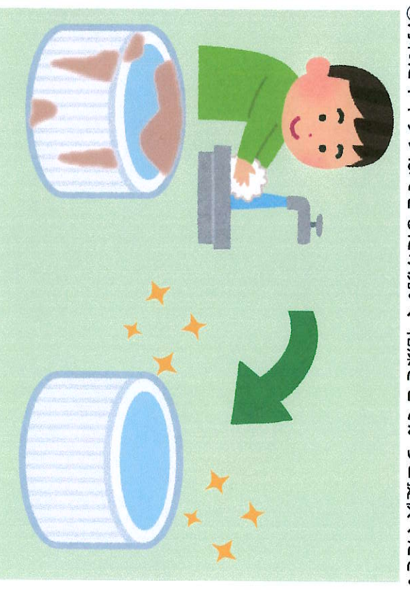
④汚れたキャップはできるだけ洗い、乾燥させてからご提供ください