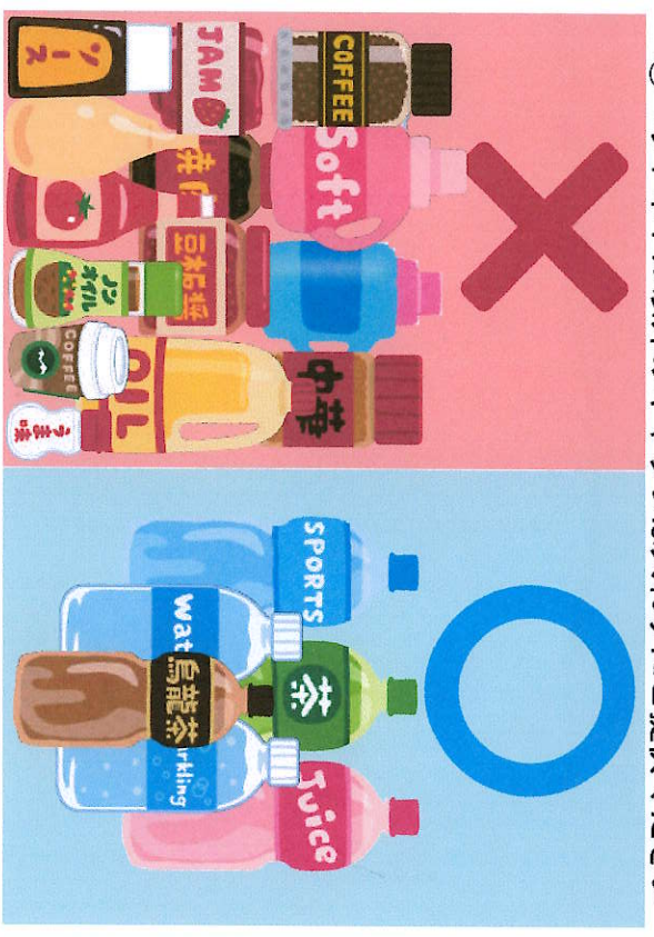
②ペットボトル以外のキャップは入れずにご提供ください